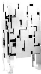
Le cabinet strata cf les buildings, les villes...