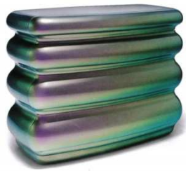
La commode Heather

La richesse des couleurs rappelle le milieu du textile (voir le dossier pédagogique sur l'exposition Raoul Dufy au musée des beaux-arts de Carcassonne). Mattia Bonetti recherche un scintillement dans la couleur qu'il obtient notamment grâce aux matériaux qu'il utilise. Il orchestre la lumière, crée des changements de couleurs en fonction du point de vue du spectateur.