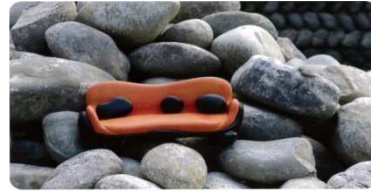
Canapé Cailloux , maquette et réalisation