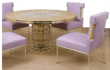
Ensemble table et chaise

Il travaille aussi les découpes et résilles, qui rappellent la dentelle.