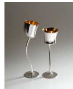
Les verres tulipes