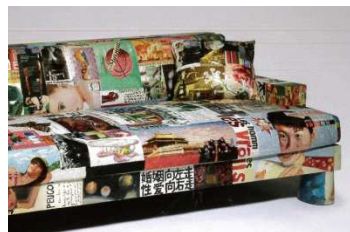
Canapé press, magazines