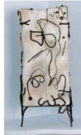
Le cabinet Quasimodo , cf les graffitis, le street art