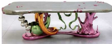
La table Abyss

On peut aussi comparer son univers à celui des Héroïc fantasy , ou merveilleux héroïque, par ses thèmes ou illustrations appréciés en particulier des adolescents, ou à l'univers du film de science-fiction Avatar de James Cameron sorti en 2009.