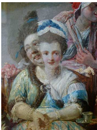
Jacques Gamelin, Scène d'intérieur , huile sur toile, musée des beaux-arts de Carcassonne

La visite et l'atelier seront proposés en fonction du thème qui aura été choisi par l'enseignant.