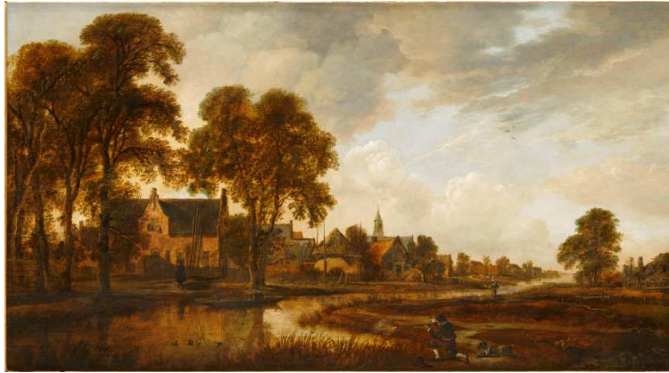
Aert van der Neer , Village hollandais au bord d'un canal , XVIIe s., musée des beaux-arts de Carcassonne