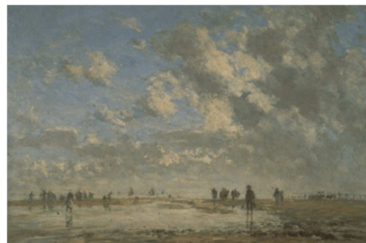
Eugène Boudin, Deauville, marée basse et Côte atlantique près de Bénerville