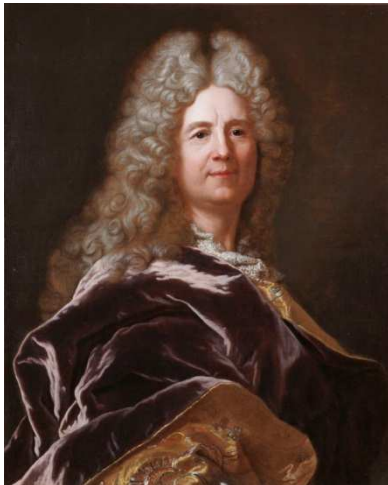
Hyacinthe Rigaud , Guillaume IV Castanier , XVIII e s., musée des beaux-arts de Carcassonne