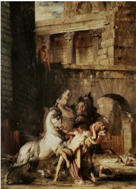
Gustave Moreau, Diomède dévoré par ses chevaux 1865, Huile sur Toile Musée des beaux-arts de Rouen

Il existe deux versions de cet exploit. Selon l'une d'entre elle, Hercule avait réuni un groupe de jeunes guerriers pour l'aider à accomplir sa tâche. Parmi eux se trouvait Abdère, un compagnon d'Hercule. Malheureusement, le jeune homme se fit dévorer par les juments alors qu'il tentait de les maîtriser. Pour venger la mort d'Abdère, Hercule captura le roi Diomède et le jeta à ses propres juments pour qu'elles le dévorent. Finalement, le héros ramena les chevaux à Argos pour les présenter à Eurysthée, et ainsi passer à la prochaine épreuve.