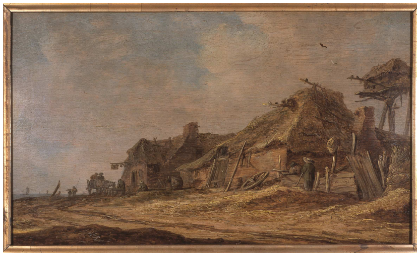
Jan Josefsz Van Goyen, Ferme au bord de la mer , 1631, musée des beaux-arts de Carcassonne