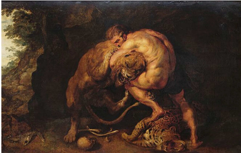
Pierre Paul Rubens, Hercule combattant le lion de Némée 17 ème siècle, Huile sur toile, musée national d'art, Roumanie

La première tâche d'Hercule fut de trouver et de tuer le lion de Némée. Cette bête sanguinaire faisait des ravages dans la région de Némée et terrorisait les habitants. Le lion était invulnérable aux flèches et aux épées. Pour le tuer, Hercule, avec sa force phénoménale, l'étrangla. Puis, en utilisant les propres griffes de l'animal, il le dépeça et se servit de sa peau comme d'une armure.