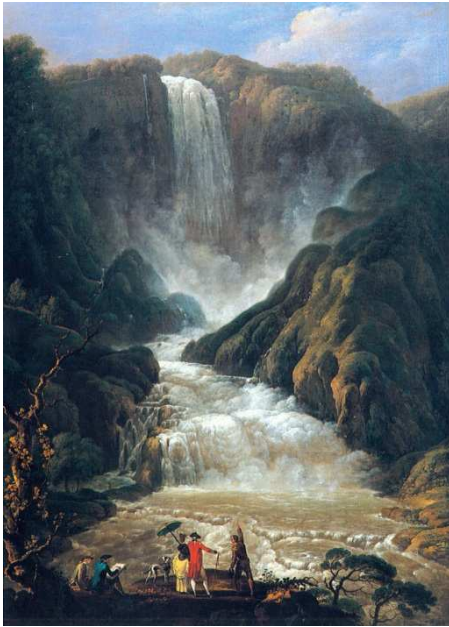
Carlo Labruzzi , La cascade de Terni , 1779, musée des beaux-arts de Carcassonne