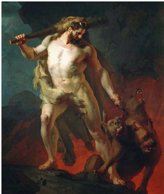
Johann Köler , Hercule sortant Cerbère des Enfers 1855, Huile sur toile musée d'art d'Estonie

Hercule fut sommé de ramener Cerbère aux Enfers, en échange de quoi il put enfin mettre fin à ses travaux et gagner sa liberté.