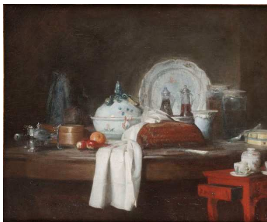
Jean-Simeon Chardin , Table d'office , vers 1763 musée des beaux-arts de Carcassonne