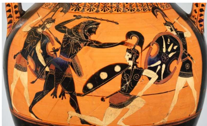
Héraclès et les Amazones , Vase à figures rouges VI ème siècle avant J.C The Metropolitan Museum of Art

En voyant l'armée approcher, Hercule pensa que les Amazones lui avaient tendu un piège. Il les affronta et tua Hippolyte avant de récupérer sa ceinture.