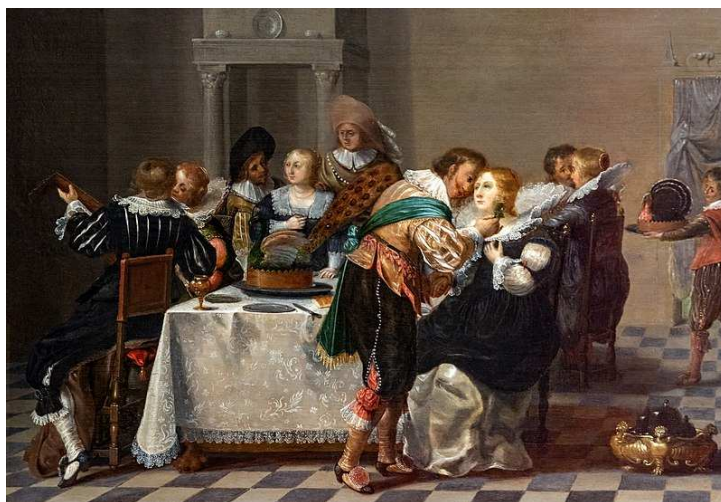
Dirck Hals , Scène galante , XVII e s., musée des beaux-arts de Carcassonne