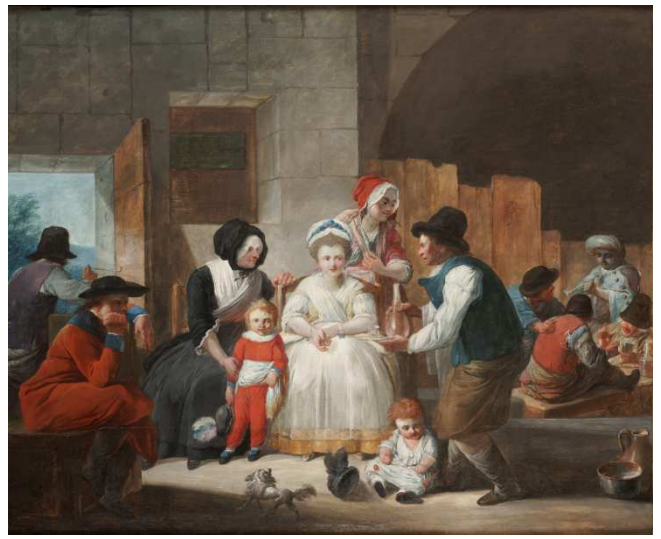
Jacques Gamelin, Scène d'intérieur , 1779 Huile sur bois, musée des beaux-arts de Carcassonne