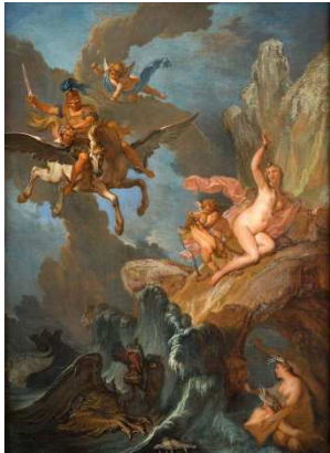
Nicolas Bertin, Persée délivrant Andromède , huile sur toile, XVIIIe s., musée des beaux-arts de Carcassonne