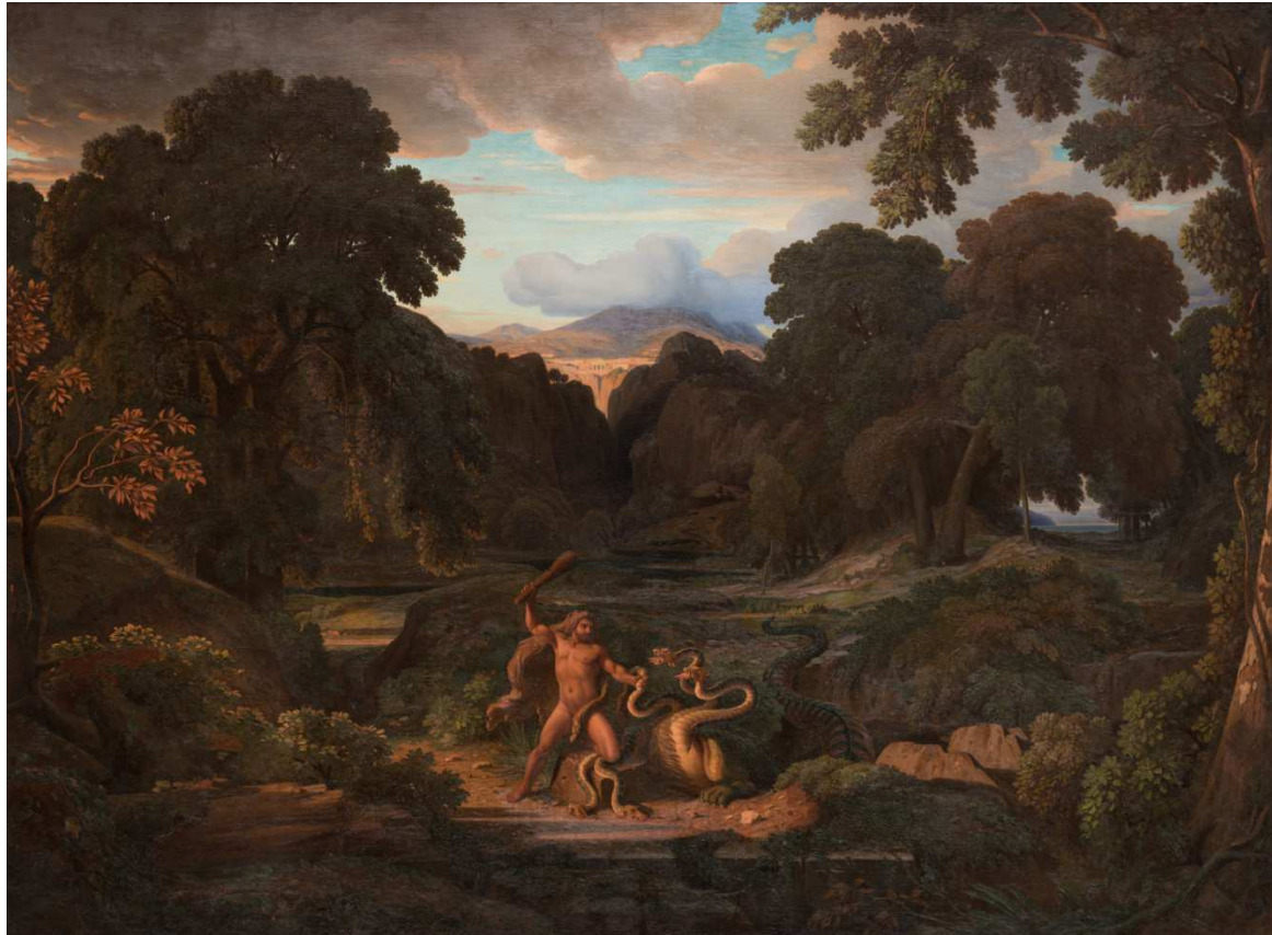
Théodore Caruelle d'Aligny , Hercule terrassant l'hydre de Lerne Huile sur Toile, musée des Beaux-Arts de Carcassonne – 1842

Dans le tableau de Caruelle d'Aligny, Hercule est représenté en train d'accomplir l'un de ses douze travaux : il s'agit de sa lutte acharnée contre l'Hydre de Lerne. Il tient dans sa main droite un gourdin qu'il brandit au-dessus du monstre; il est vêtu de la peau du Lion de Némée, un redoutable fauve qu'il a dû affronter lors de sa précédente tâche.