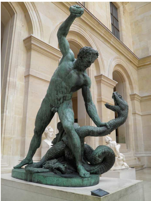
Carbonneaux, Hercule combattant Acheloius métamorphosé en serpent. Bronze, 1824, Musée du Louvre

reste immobile, par sa masse affermi. Nous nous éloignons pour reprendre haleine ; nous nous rapprochons avec une nouvelle ardeur. Résolus de ne plus reculer, nous tenons ferme sur l'arène. Mes pieds touchent ses pieds, mes doigts ses doigts ; mon front heurte son front. Tels j'ai vu deux taureaux fougueux s'entrechoquer dans la plaine, tandis que la génisse, prix du combat, paisible attend son superbe vainqueur. Les troupeaux regardent avec effroi cette lutte terrible, incertains auquel des deux rivaux appartiendra l'empire du bocage. Trois fois, mais sans succès, Hercule veut délivrer sa poitrine, que sur la mienne je tiens fortement pressée. Par un quatrième effort, il me repousse, dégage ses bras ; et soudain (puisque je dois tout dire), il me surprend, me retourne, s'élance sur mon dos, et (vous pouvez m'en croire, je ne cherche point dans ce récit une gloire vaine) je crus sentir sur tout mon corps le poids d'une montagne. Inondé de sueur, j'arrache enfin mes bras des nœuds que ses bras nerveux formaient autour de moi. Il me presse sans relâche ; épuisé de lassitude, je ne puis reprendre haleine. Il me saisit à la gorge : je chancelle, je touche du genou la terre, et je mords la poussière. J'allais succomber dans cette lutte inégale. J'appelle la ruse à mon secours, et, sous les traits d'un énorme serpent, je veux tromper et vaincre mon rival.