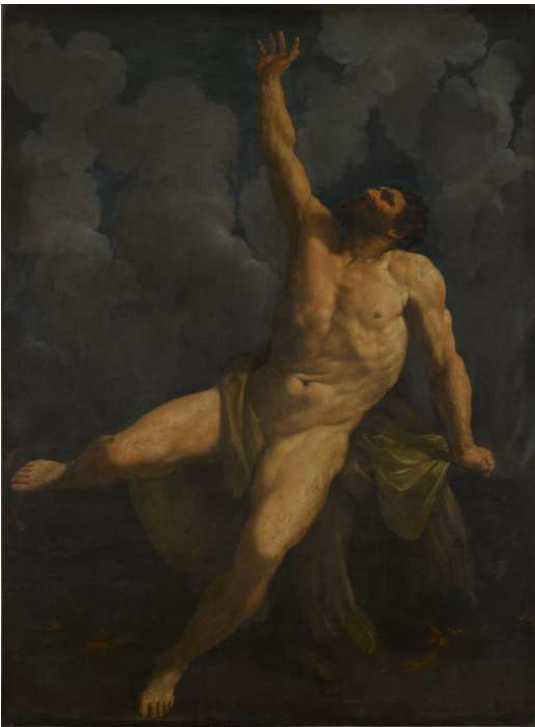
Guido Reni , Hercule sur le bûcher - 1617 Huile sur Toile Musée du Louvre

Hercule ensuite construit un bûcher avec les arbres qu'il a abattus, remet son arc, son carquois et ses flèches à Philoctète (son compagnon), et charge celui-ci d'allumer le bûcher ; ensuite, il se couche sur la peau du lion de Némée posée au sommet, et, environné de flammes, il attend la mort avec sérénité. Les dieux s'inquiètent du sort de ce bienfaiteur de l'humanité.