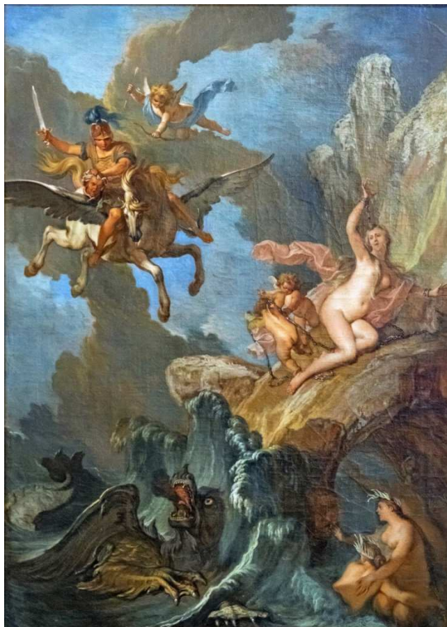
Nicolas Bertin , Persée délivrant Andromède Huile sur Toile, entre 1700 et 1725 musée des beaux-arts de Carcassonne

Le musée de Carcassonne conserve un tableau de Nicolas Bertin où Persée délivre la princesse Andromède. Chevauchant le légendaire Pégase, tenant la tête de Méduse, il s'élance au combat dans une posture héroïque.