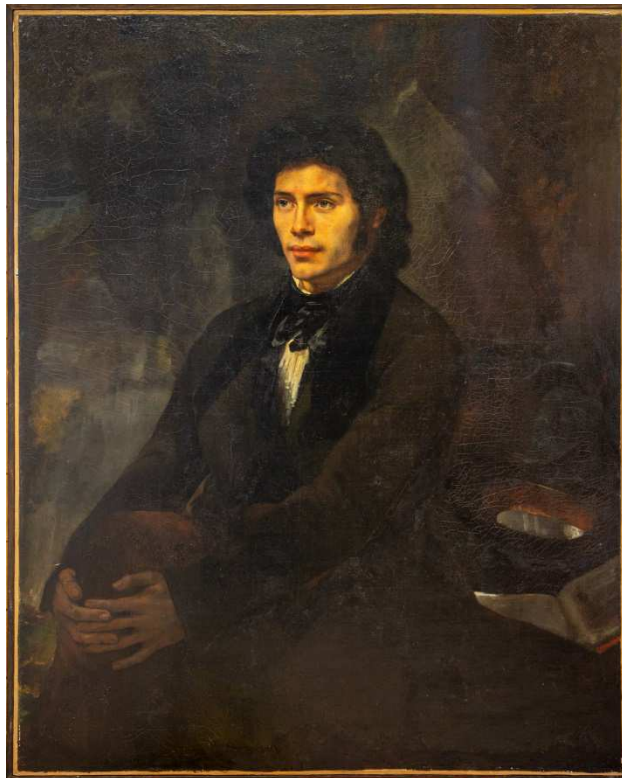
Alphonse Duverget, Portrait de Caruelle d'Aligny Musée de la Faïence et des beaux-arts de Nevers – 1828

Claude-Théodore Félix Caruelle d'Aligny naît le 24 janvier 1798 au château de Chaumes à Chantenay, dans la Nièvre.