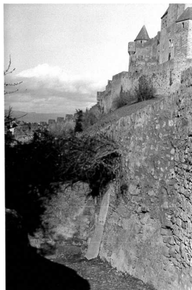
Bernard Plossu, La Cité de Carcassonne, 2010, photographie, musée des beaux-arts de Carcassonne

Le Land Art et l'Arte Povera, à partir des années 60, imposent une réflexion nouvelle sur l'environnement, l'espace et le temps. Ils sont une tentative d'harmonie entre l'homme et la nature.