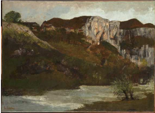
Gustave Courbet, Les rochers d'Ornans , huile sur toile, musée des beaux-arts de Carcassonne