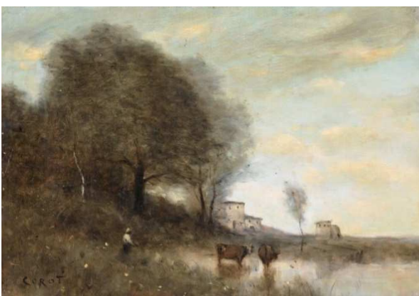
Camille Corot , Paysage , XIXe s. musée des beaux-arts de Carcassonne

De grands peintres paysagistes tels Friedrich et Constable imposent une vision naturaliste du paysage. Dès 1850, le Réalisme (qui recherche le « vrai », tant social que naturel, en s'opposant aux règles académiques) s'annonce, car artistes et écrivains reviennent aux études d'après nature, pour peindre la réalité comme le font Corot et les artistes de l'école de Barbizon. Sous l'influence de Turner et de ses recherches sur la lumière et la matière, l'Impressionnisme suit. L'accent est dès lors mis sur la subjectivité de l'artiste (et du spectateur qui accorde ou non à ce qu'il regarde le statut d'œuvre d'art) : la nature s'offre à la perception de l'artiste sous forme d'un répertoire, d'un dictionnaire de signes, couleurs, formes qu'il utilise selon sa sensibilité, ses préoccupations, ses recherches, pour créer de nouvelles résonances. Des artistes comme Monet, Sisley, Pissarro, s'intéressent à la variation des couleurs, à la dissociation des phénomènes lumineux et à la restitution des impressions, en mettant l'accent sur la faculté de changement de la nature elle-même.