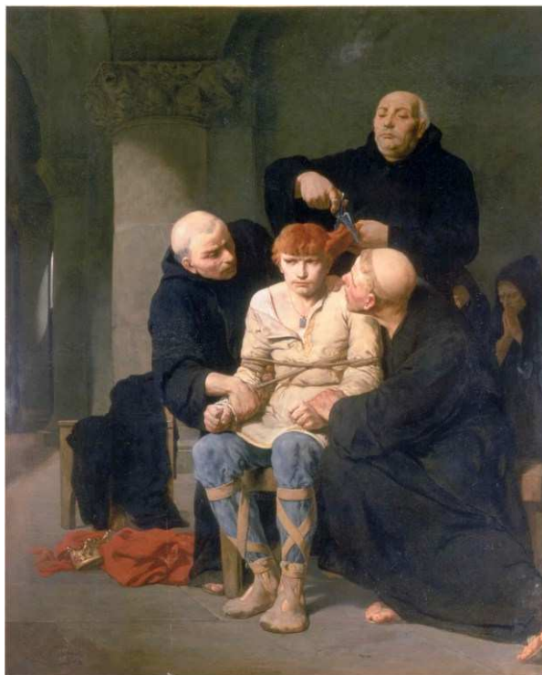
Evariste-Vital Luminais, Le dernier des Mérovingiens , XIX e s., musée des beaux-arts de Carcassonne